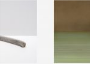
Process 2017 (detail) 2016