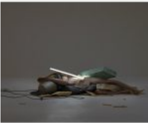
Collaboration of fragments